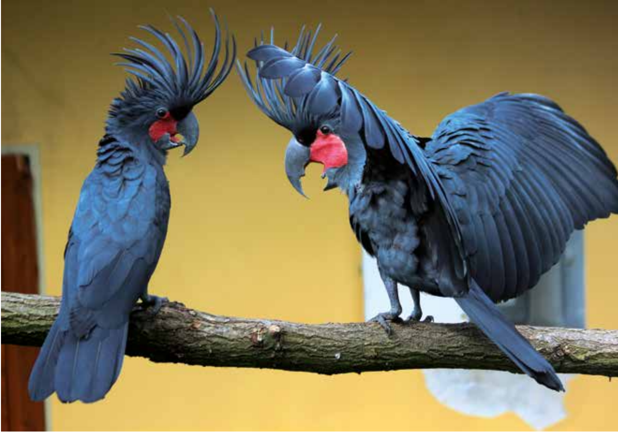
Kakadu palmový (Probosciger aterrimus) se stejně jako ostatní papoušci v toku předvádí.

nároky jsou pro papoušky z odlišných biotopů a podnebných pásů různé. Existuje jediný typicky alpský druh papouška vyskytujícího se nad hranicí sněhu, a tím je novozélandský nestor kea ( Nestor notabilis ). I některé další druhy se pravidelně setkávají s teplotami pod hranicí mrazu. Těmto druhům mrazivé hodnoty v průběhu zimy nevadí. Existují však i druhy, které naši střeoevropskou zimu zdánlivě přežijí bez problému, avšak organismus se natolik vyčerpá, že papoušci nemají na jaře dostatek energie, aby začali hnízdit. K této okolnosti je při hodnocení neúspěchu chovatelské sezóny také třeba přihlídnout.