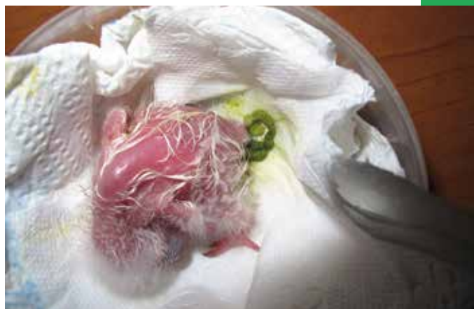
První trus je dobrým signálem fungující peristaltiky.

Před odstavenem, kdy je mládě již zcela opeřené, se kapacita volete opět zmenšuje. Doporučené množství je opět maximálně do 10 %.