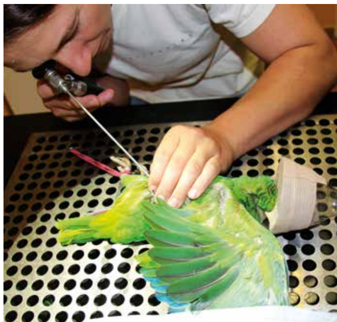
Zjištění pohlaví endoskopicky je otázkou minuty.

Papoušci jsou přirozeně zvědaví a často samozvaně okousávají zařízení domácnosti nebo součásti voliéry, o nichž majitel nepředpokládal, že by mohly být v hledáčku zájmu jeho papoušků. A tak se celkem často setkáváme s cizími tělesy v žaludku. Jsou-li drobné, za pomoci vlákniny a dále