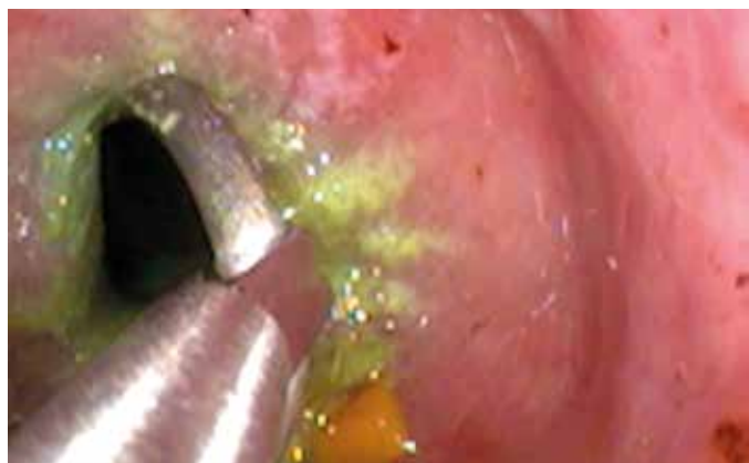
Odstranění cizího tělesa ze žaludku endoskopicky je velmi šetrné, ale náročnější na provedení než chirurgické.

vhodných léků se obvykle dříve či později podaří dostat je ven přirozenou cestou přes střeva a kloaku.