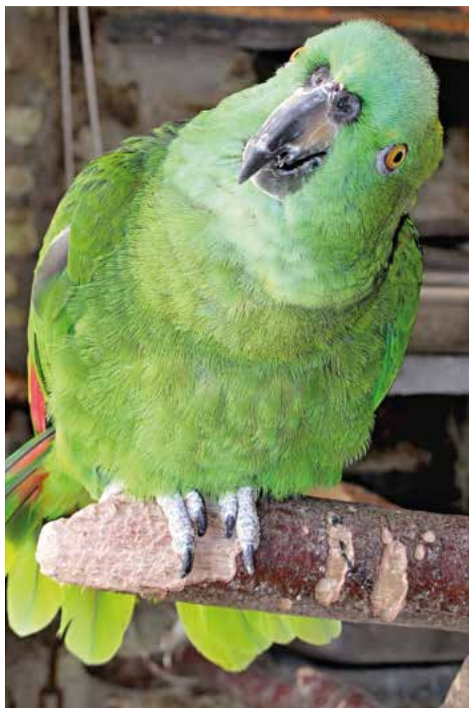
Amazoňan žlutokrký (Amazona auropalliata) je vhodným společníkem a imitátorem pro zkušenější chovatele.

Úkolem této knihy mimo jiné je otevřít oči chovatelům a majitelům ptačích domácích mazlíčků tohoto typu. Bez porozumění,