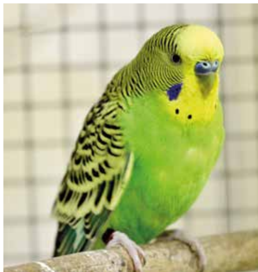
Pohlavní dimorfismus u papoušků vlnkovaných – andulek ( Melopsittacus undulatus ) je dobře patrný podle barvy ozobí. Samec má modré (viz foto), samice hnědé.

Existují dvě základní metody. Endoskopie a určení pomocí PCR vyšetření – polymerázové řetězové reakce (polymerase chain reaction). Mezi chovateli známé zkráceně jako DNA.