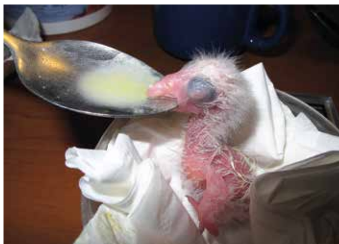
První krmení trichy orlího po vylíhnutí.