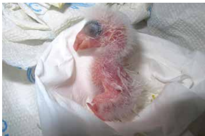
Mládě trichy orlího.